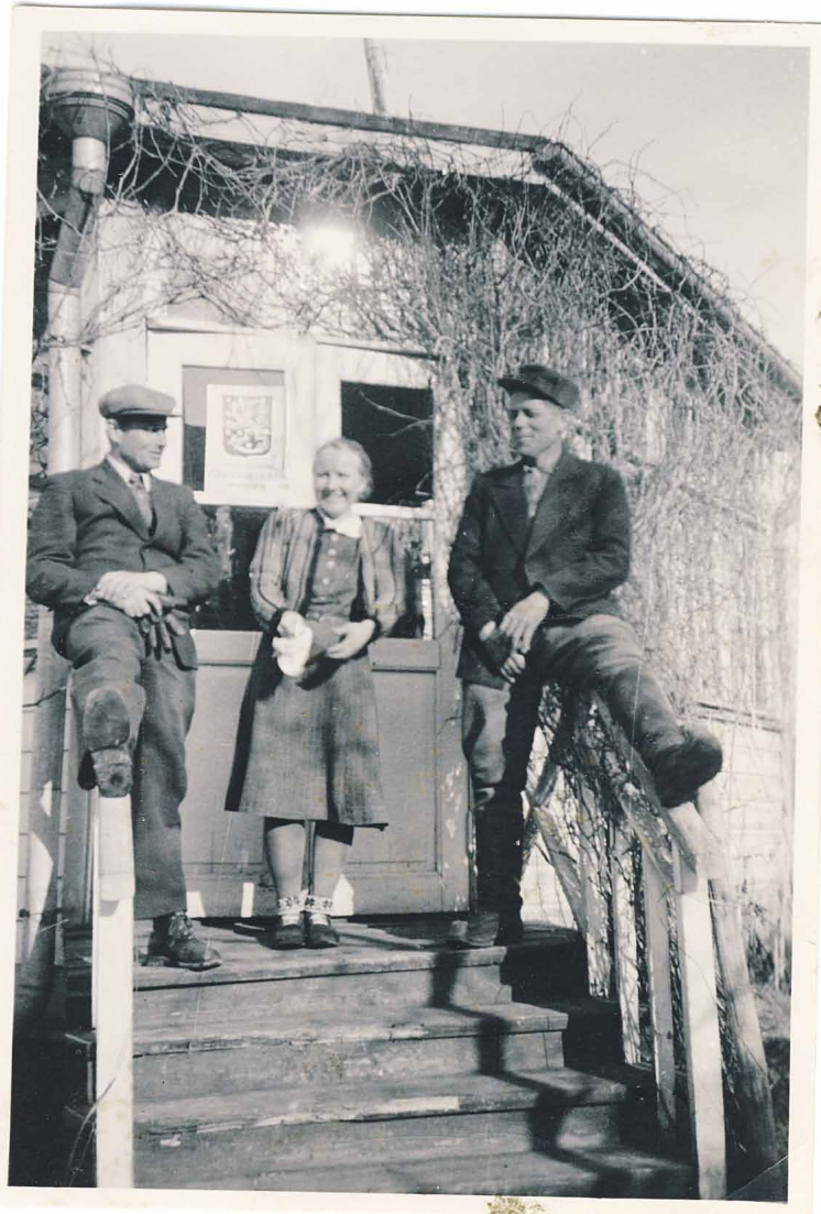
Kunnan esikunnan rakennuksen portaikko. Elli Konton kokoelmasta

Kaikesta huolimatta ei epäilty paluun mielekkyyttä, - oltiinhan nyt kotona. Paljon oli saatu aikaan ja suunnitelmia tulevaisuutta varten oli runsaasti niin yksityisillä henkilöillä kuin kunnallakin, mutta kohta kaikki muuttui ja alkoi viides muutto.