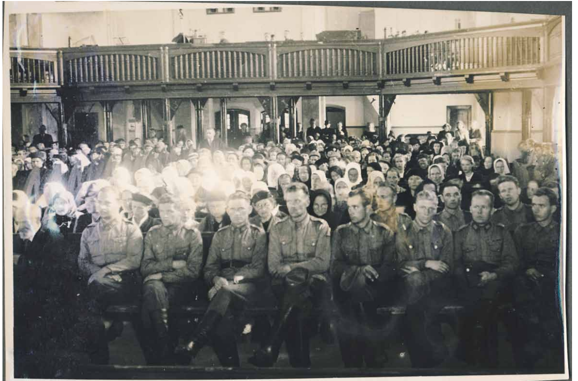
Kuva Koiviston valtauksen yksivuotisjuhlasta 6.9.1942.

Kunnanvaltuusto kokoontui koti- seudulla neljä kertaa. Ensimmäinen kokous oli 12.10.1942, vuonna 1943 kokoonnuttiin kaksi kertaa ja viimeinen kokous Koiv- istolla oli 23.1.1944.