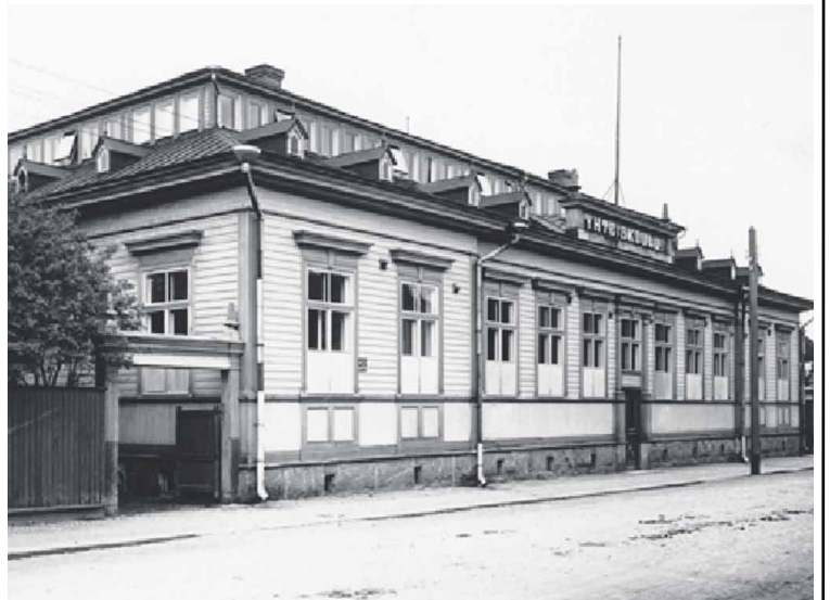
V. 1951 palanut Porvoon yhteislyseon puinen rakennus Piispankadun varrella. Uudisrakennus valmistui samalle paikalle v. 1953 (Nykyinen Linnankosken lukio)

vasta tunnin loputtua, että ikkunalaudan kukkaruukuista yksi oli pudonnut lattialle ja mennyt rikki. Tarkastaja ei sitä kuitenkaan tarkastuskertomuksessaan maininnut.