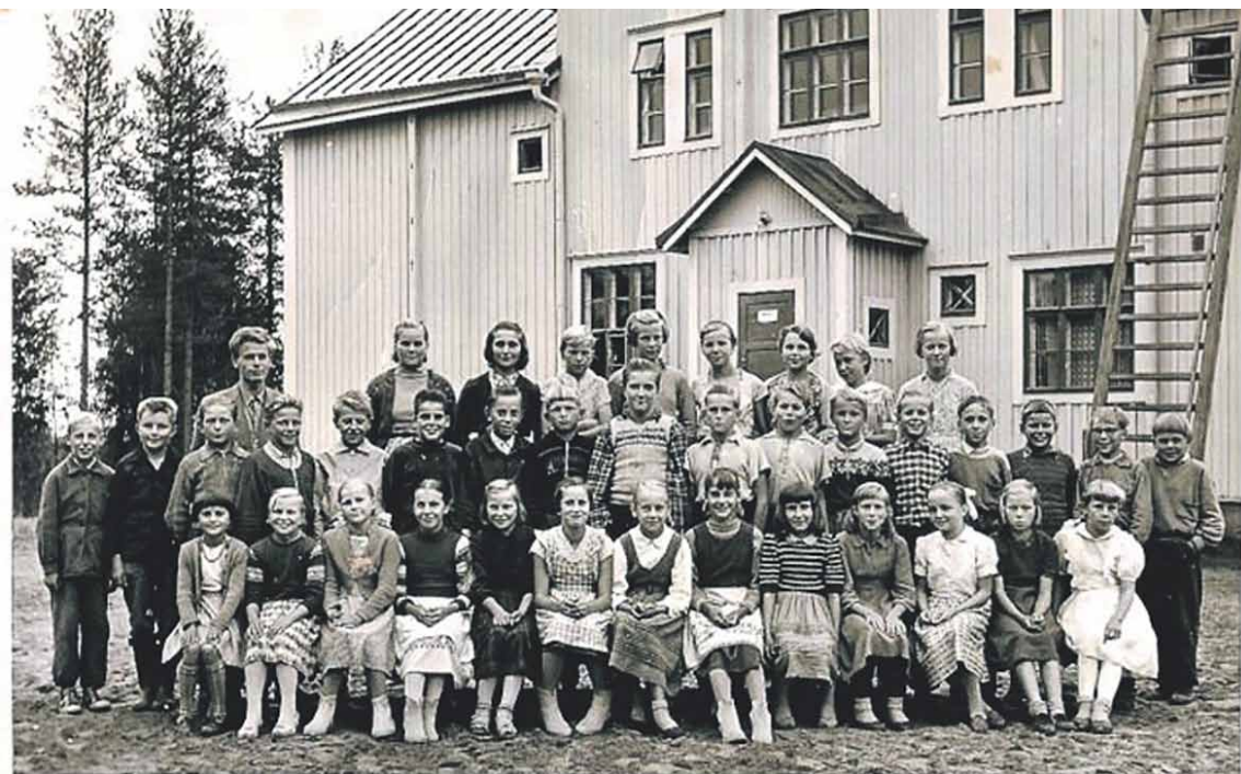
Se "maisteriksi mainittu" takarivissä vasemmalla

Keväällä kylällä kohistiin, kun uskalsin jättää neljäsluokkalaisten pojan luokalle, koska tämä ei osannut lainkaan lukea.