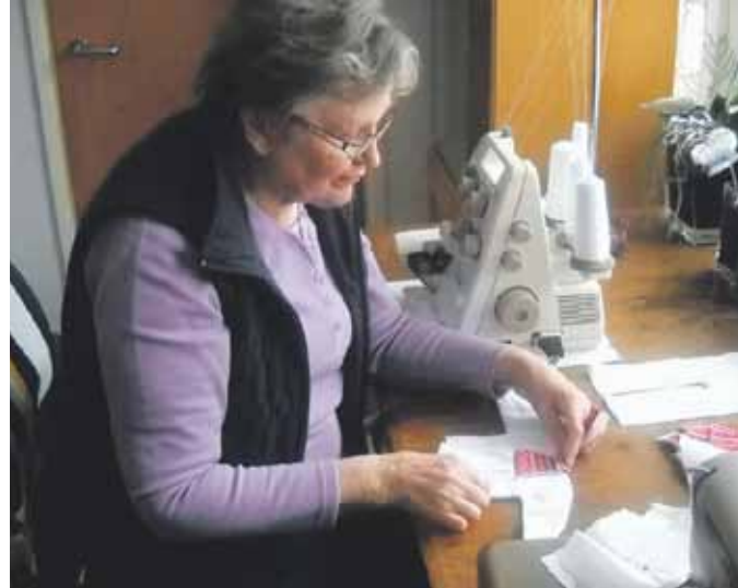
Kyllikki rekon teossa