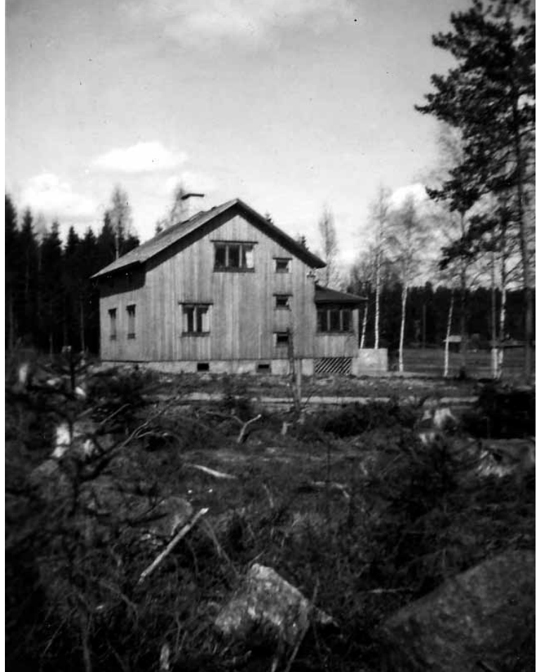
Ilmastin juuri valmistunut talo.

Muistan tapauksen, kun kovien sateiden jälkeen pellon kanta-oja ei jaksanut vetää ja vesi nousi laajalle alalle laakealla pellolla. Alkutilven pakkaset jää- dyttivät pellolle nousseen veden ja siitä muodostui talven ensim- mäinen luistinrata. No, kylän lapset valloittavat "luistinradan" ja lätkämätsit alkoivat. Viidak- korumpu koulussa viestii hyvästä luisteluradasta ja seuraavina päi- vinä pellolla on tungosta. Tästä- hän pellon omistaja ei pitänyt al- kuunkaan ja luistelijat hädätään kovaäänisesti luistinradalta. Kek- seliäinä poikina menemme kui- tenkin illan pimetessä takaisin. Seuraavana päivänä illan pime- nemistä odotetaan pitkäjännit- teisesti. Vihdoin tuli riittävän pi-