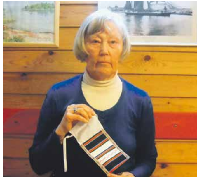
Kaisa ja eka essu